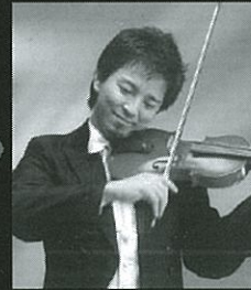
吉岡 克典 (ヴァイオリン)