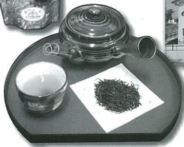
かぶせ茶「緑のしずく」