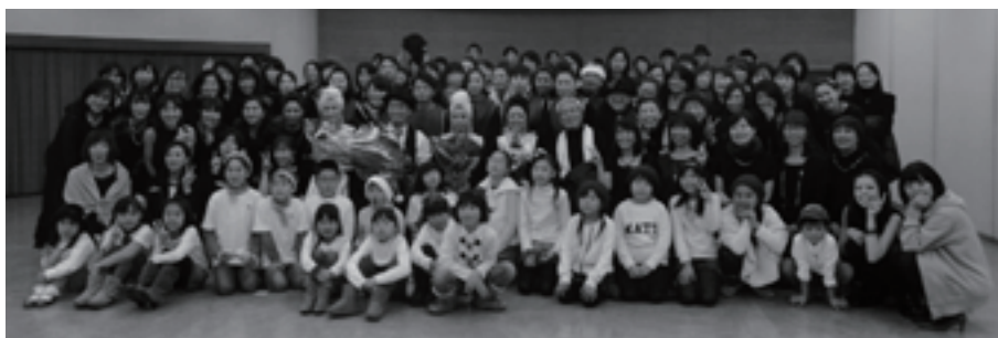
2014年度 鈴ゴスメンバー&コンチネンタルファミリー